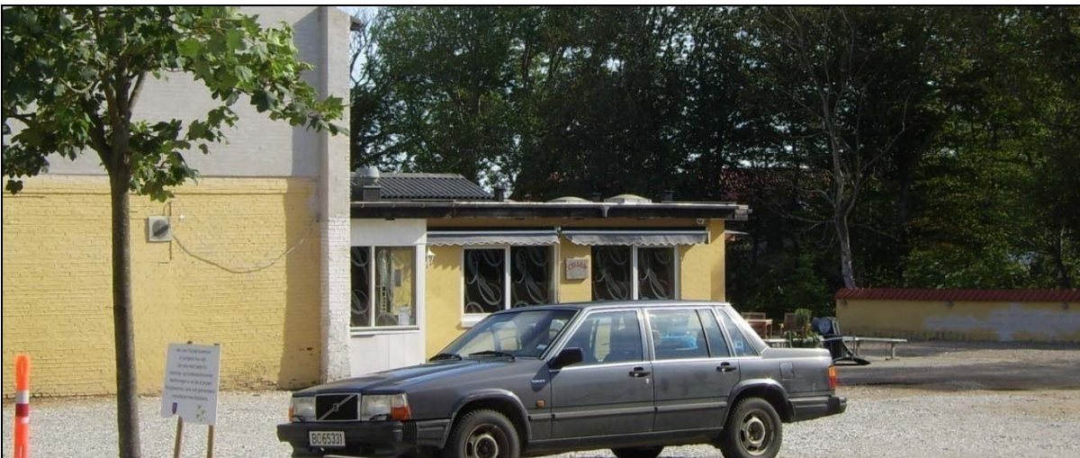
Foto: Før og efter billede af krobygningen og nabobebyggelsen på hovedgaden, hvor den ene ende er nedrevet. Her er der nu etableret udeservering for kroen og parkering.

Den tredje type ses i projektet "Mulighedernes hus", som bliver et nyopført plus-energihus i halvanden etage, der kan veksle mellem 1 og 2 boenheder afhængig af ejerens behov. Adressen er Klostergade 47-51, og på hver side er der således yderligere en grund, hvor håbet er, at interesserede købere bygger nyt og spændende. Margrethevej 2 søges solgt som byggegrund med dens relativt attraktive placering op imod Kirkemusikskolens have og et grønt område.