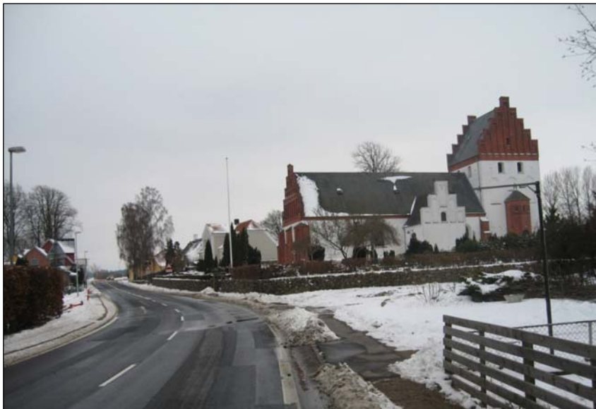
FOTO: Hovedgaden gennem Vester Hæsing set mod syd med Birkevej 25 til højre fra stakittet og frem.

Kirken har desuden den udfordring, at den ikke har egen parkering og desuden har en stejl, svingende opkørsel, der munder ud i svinget på hovedgaden, som er uden fortov på denne strækning. Opkørslen benyttes bl.a. af bedemændene ved begravelser, og de trafikale forhold har givet anledning til flere farlige situationer.