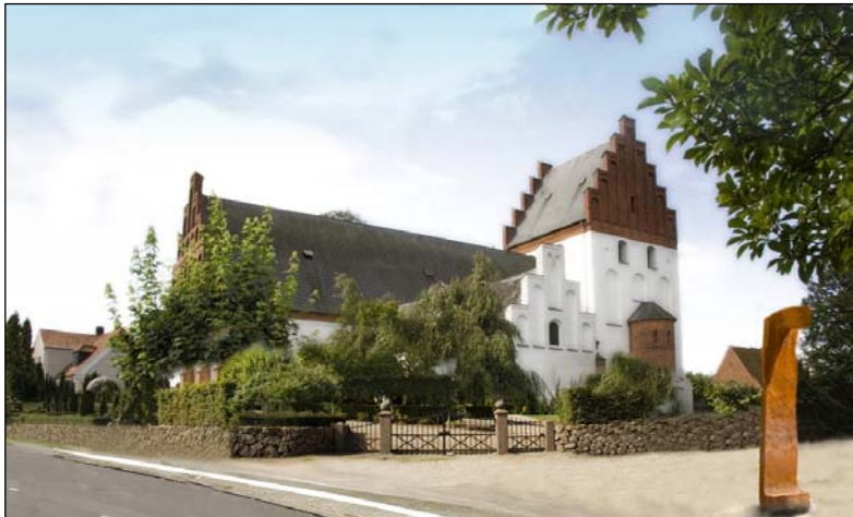
FOTO: Visualisering af den nye opkørsel og parkeringsplads ved kirken fra landsbyens helhedsplan. Opkørslen er i dag på det stykke af muren, umiddelbart efter den klippede hæk. Visualisering og

Kroen overfor blev købt af Faaborg-Midtfyn Kommune på tvangsaktion og er efterfølgende nedrevet. Købet var betinget af, at lokalrådet efter nedrivningen ville købe grunden, og der arbejdes nu med forskellige anvendelsesmuligheder. Da skolen i Vester Hæsing står overfor en lukning, skal lokalrådet afklare, om man har brug for nye fælleslokaler eller andre faciliteter, eller om krogrunden skal sælges til byggeri. Lokalrådet og kommunen har i forbindelse med handlen indgået en aftale om, at en del af grunden kan bruges til en eventuel vejudvidelse eller til sikring af oversigtsforholdene i svinget.